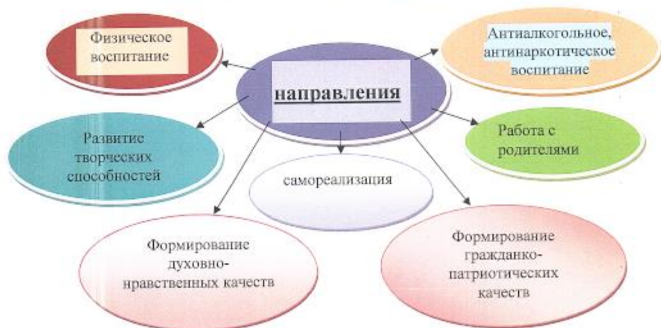
Схема модели выпускника :