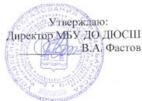
ГРАФИК проведения внутришкольного контроля учебно-тренировочного процесса МБУ ДО ДЮСШ на 2020-2021 учебный год