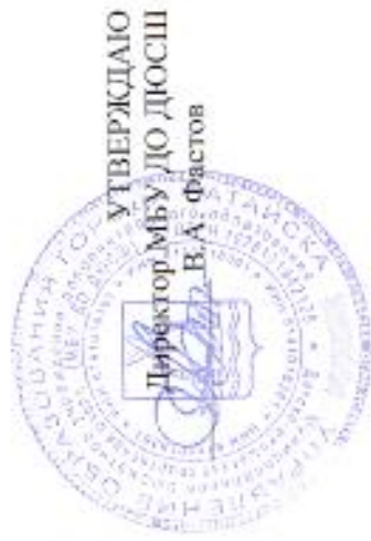
ГРАФИК ПРОВЕДЕНИЯ ОТКРЫТЫХ УЧЕБНО-ТРЕНИРОВОЧНЫХ ЗАНЯТИЙ на 2020-2021 учебный год